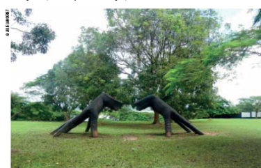
Les Maires de Calabar.

► VTC : bien sûr disponible à Calabar. Coût 400 à 1 000 NGN pour une course. ► Chauffeur privé : opter pour un chauffeur local de confiance recommandé par votre hôtel (vérifier la qualité de la voiture et que le chauffeur soit en possession de ses papiers).